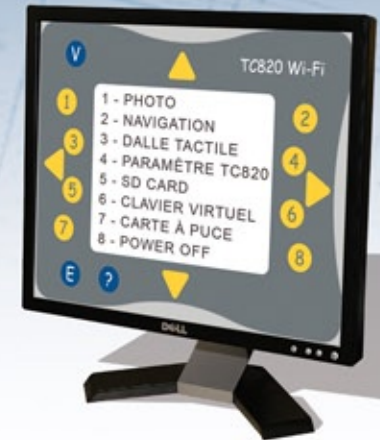
Simulation Interface Homme Machine