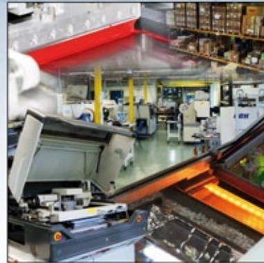
Gestion de la production