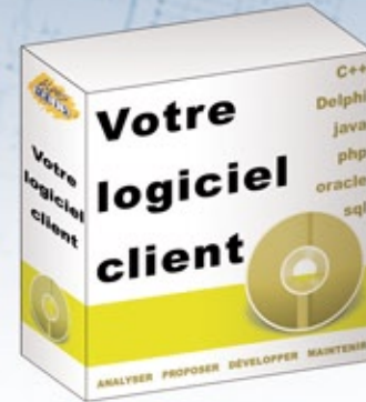
Développement de logiciel