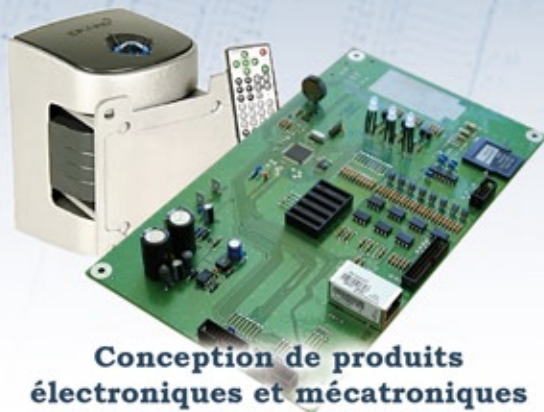
Conception de produits électroniques et mécatroniques