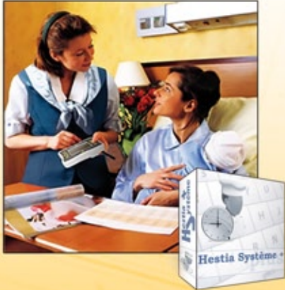
Gestion de la restauration hospitalière