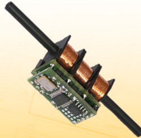
Capteur de déplacement sans contact